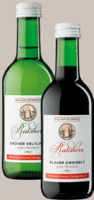
Winzer Kreams Ratscherr Grüner Veltliner | Ratscherr Zweigelt 0,25 Liter per Flasche