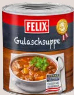
Felix Gulaschsuppe 3/1