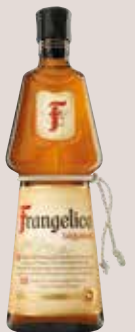
Frangelico 20%, 0,7 Liter