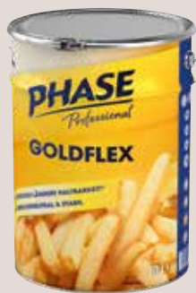
Upfield Goldflex Premium 10 Liter