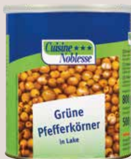
Cuisine Noblesse Grüne Pfefferkörner in Lake, 850 ml