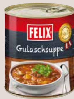
Felix Gulaschsuppe 1/1