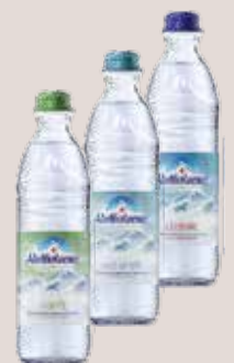
Adelholzener Mineralwasser Classic, Sanft oder Naturell, 0,33 Liter Glas, MW, zzgl. Pfand per Flasche