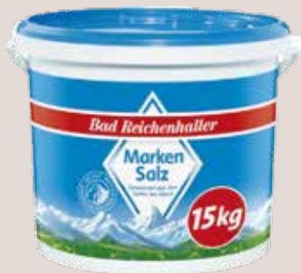
Bad Reichenhaller Markensalz 15 kg