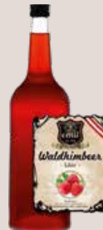
emil-Spirituosen Waldhimbeerlikör 20% Vol., 1 Liter