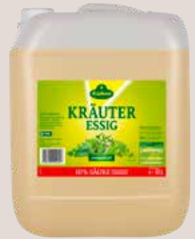
Kühne Kräuteressig 10%, 10 Liter