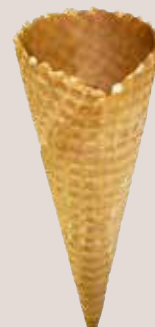
Stenger Classic Tüte 500 Stück